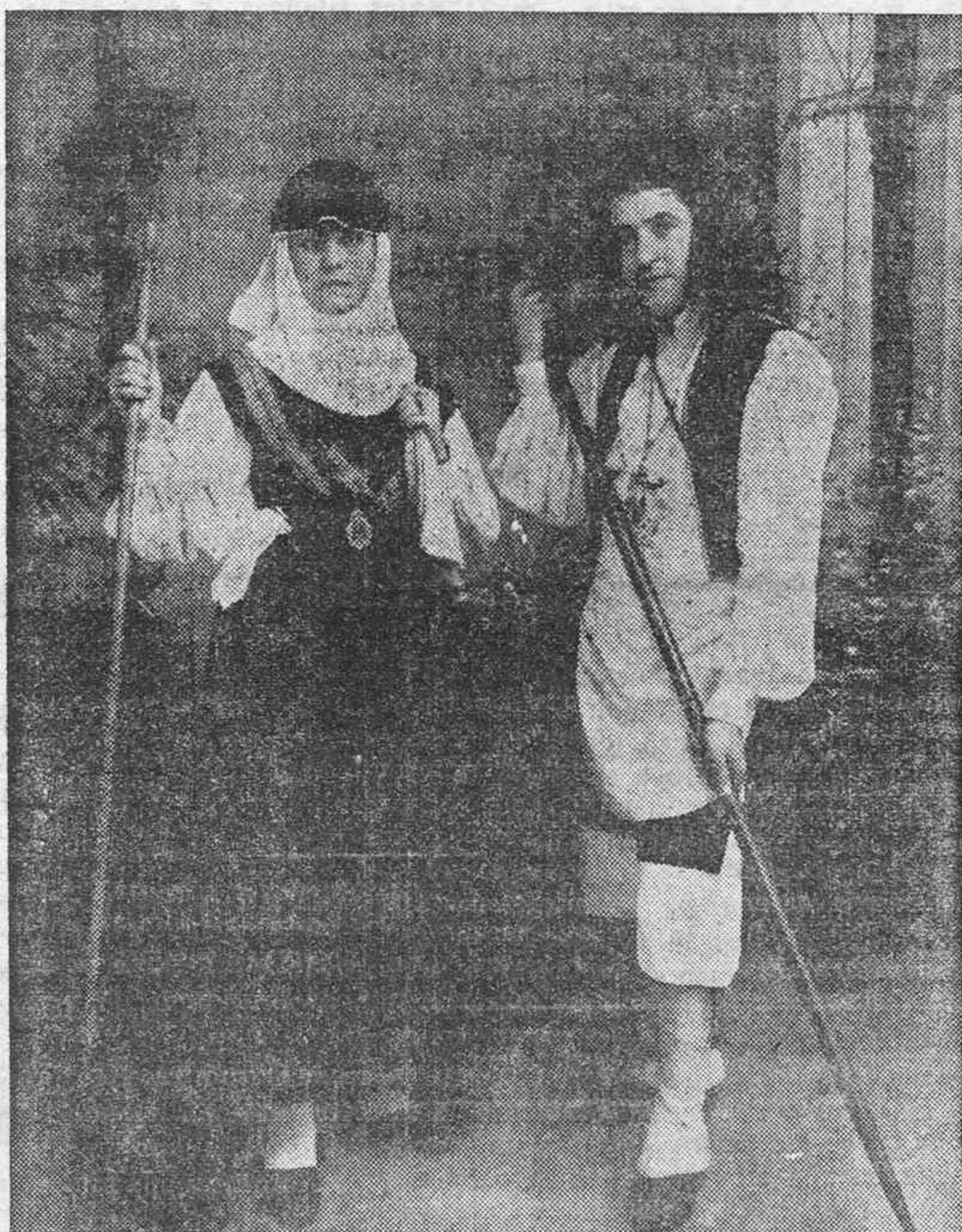
VESTIMENTA QUE USABAN LOS CAMPESINOS DE GARAFIA, EN LA PALMA.—(De la colección Pelayo López)

puesto autor, que afirma el propósito de Bargiela de publicar una novela con el título de "La casa de la Troya"; pero, el caso es que el original no aparece, si existe.