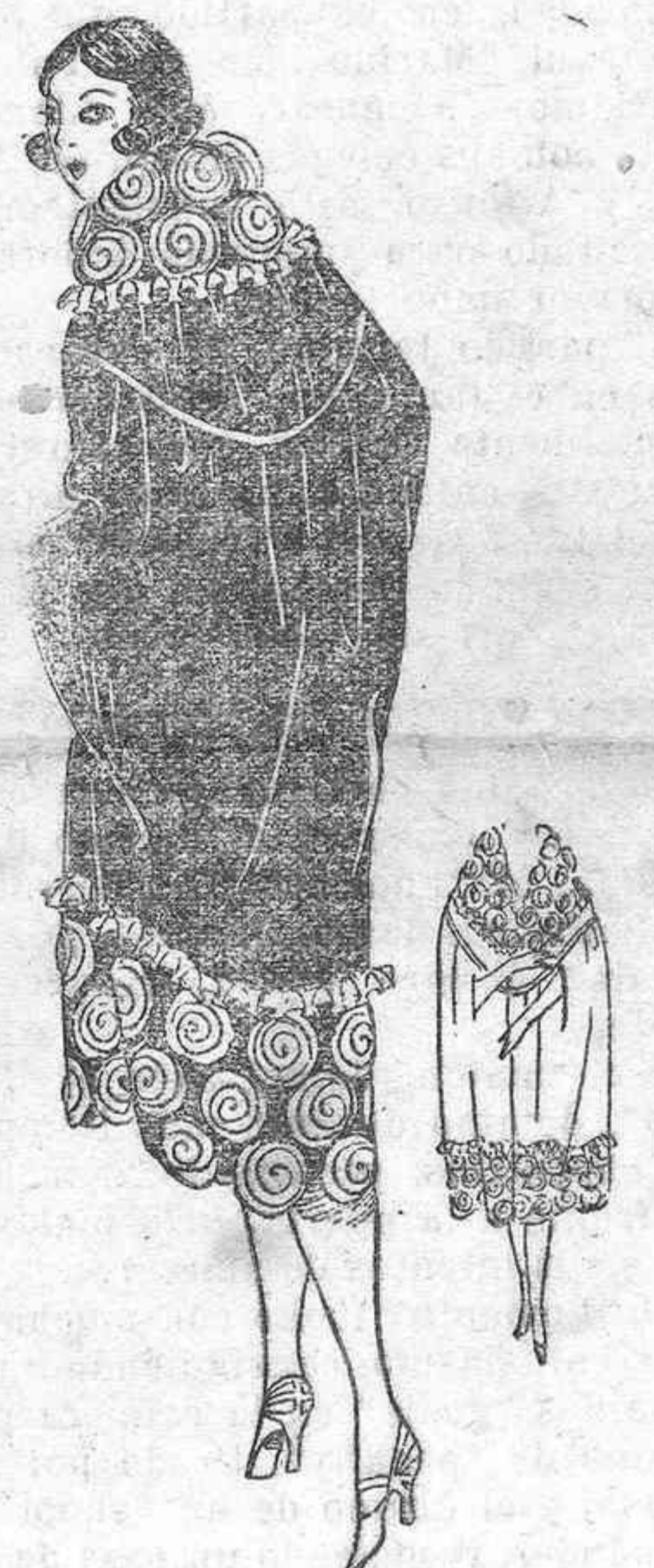
CAPA DE NOCHE

No se olviden de visitar este almacén y se convencerán de lo barato que vende LA CIUDAD DE TENERIFE, calle de Santo Domingo, número 6. (Por debajo de la revista.)