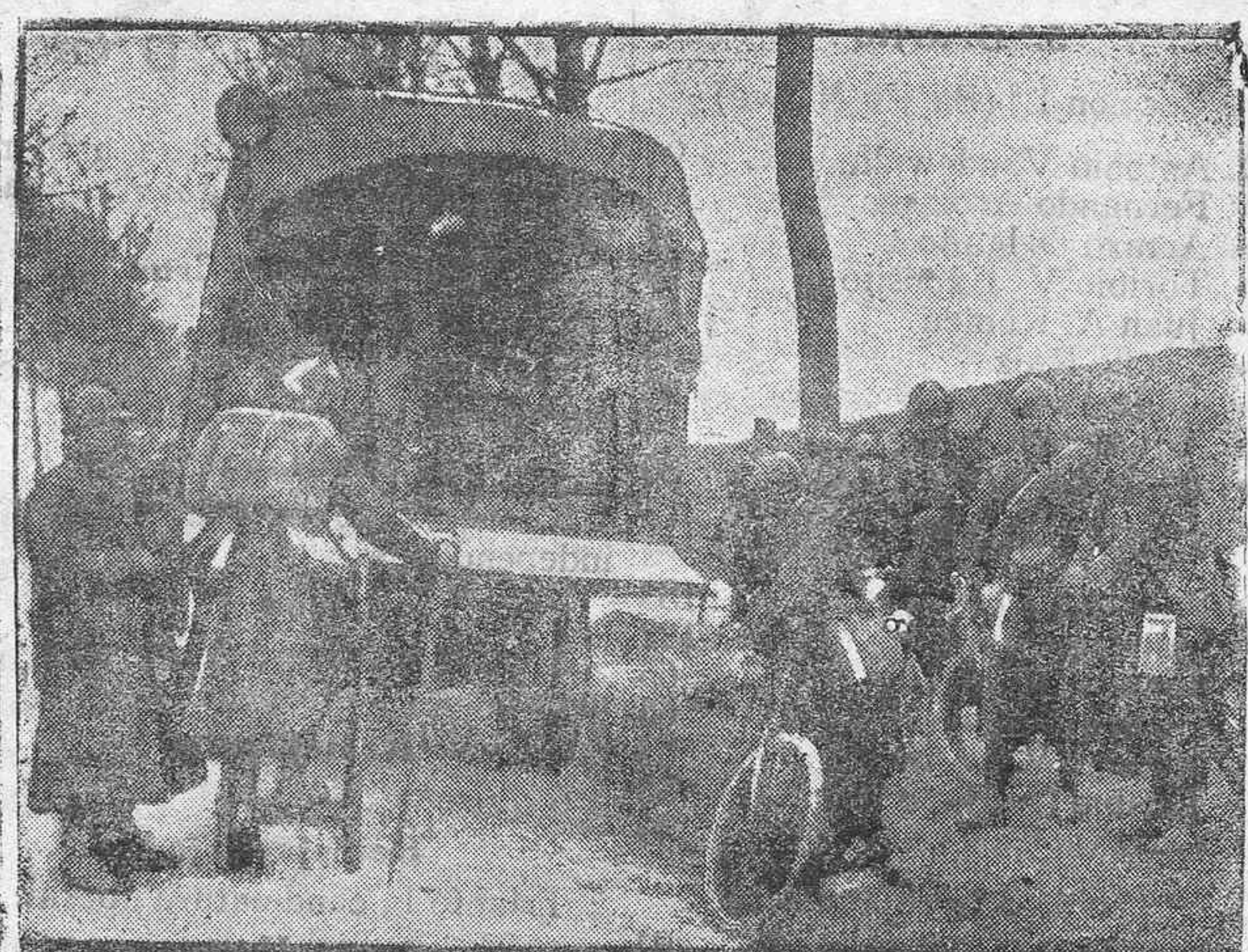
Camión para conducir a los soldados a la línea de fuego

Se venden muebles del extranjero, algunos finísimos.—Calle Numancia número 37, de 3 a 5.