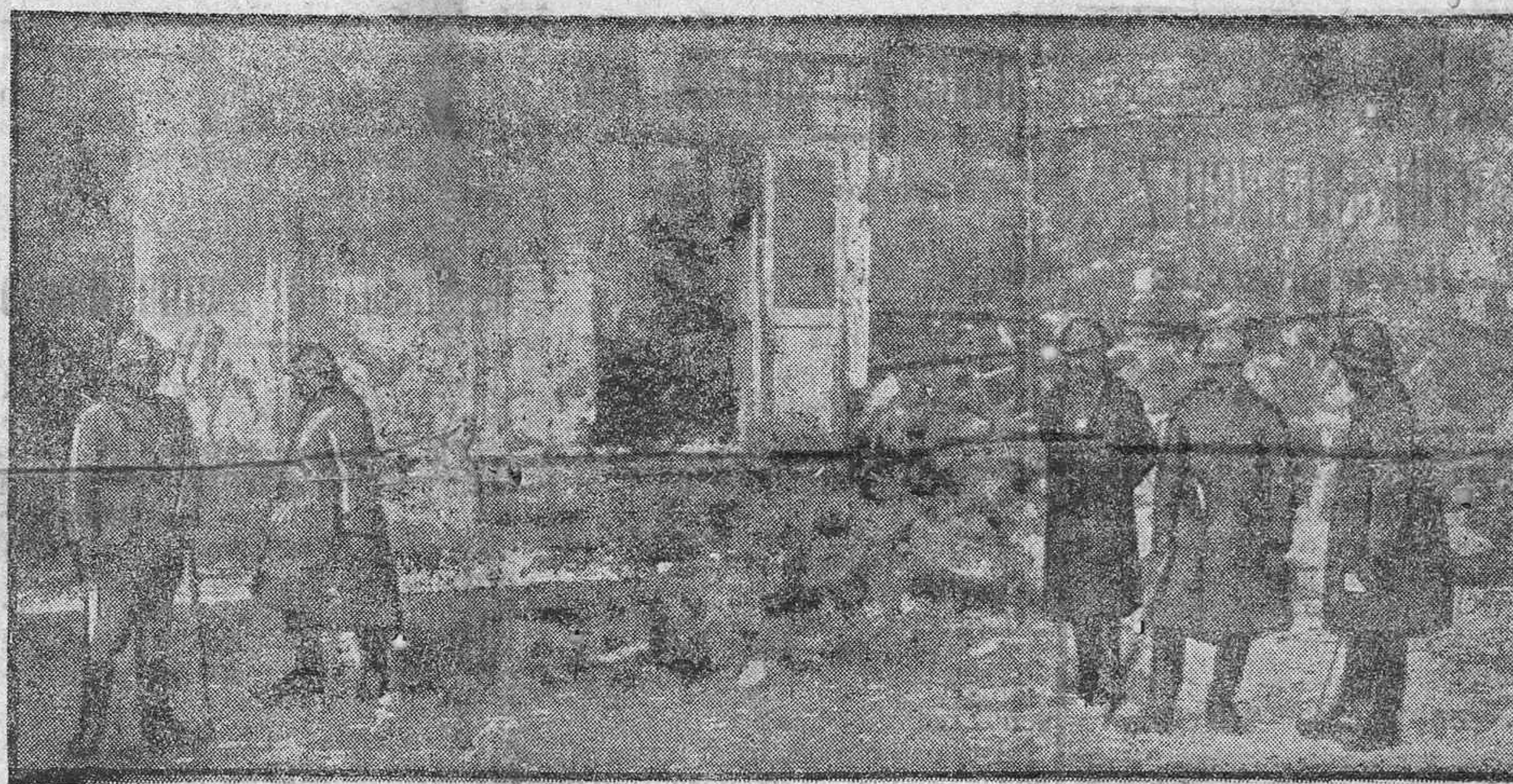
En las ruinas de Coency.—El general Humbert inspeccionando las nuevas posiciones francesas

Se venden barricas vacías.—Darán razón: Viera y Clavijo, 12