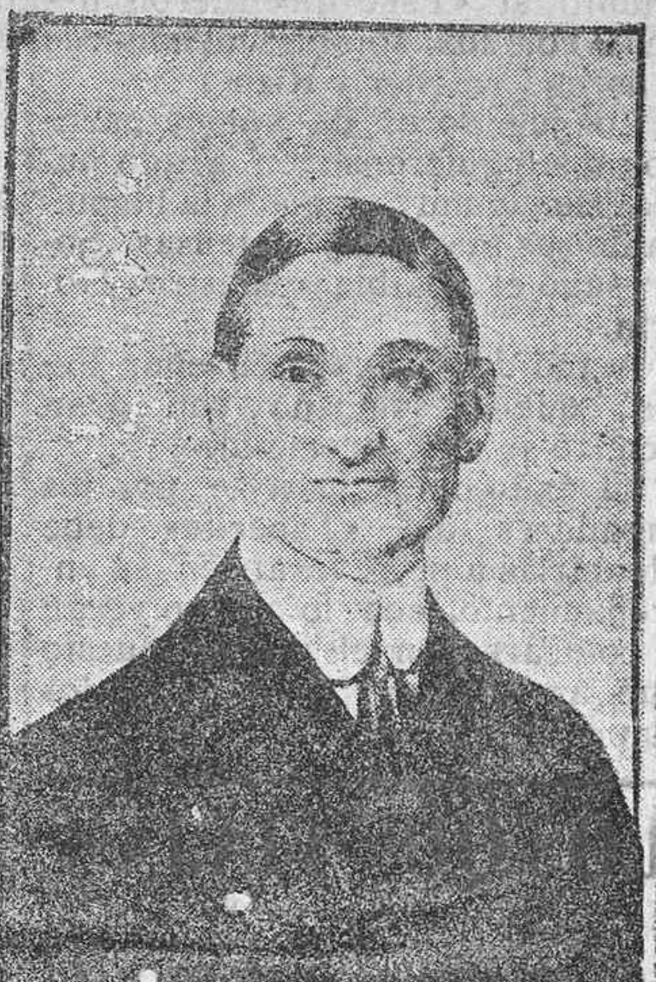
El ministro de la Hacienda de los Estados Unidos, que acaba de obtener un gran éxito con el segundo empréstito de quince mil millones para las atenciones de la guerra