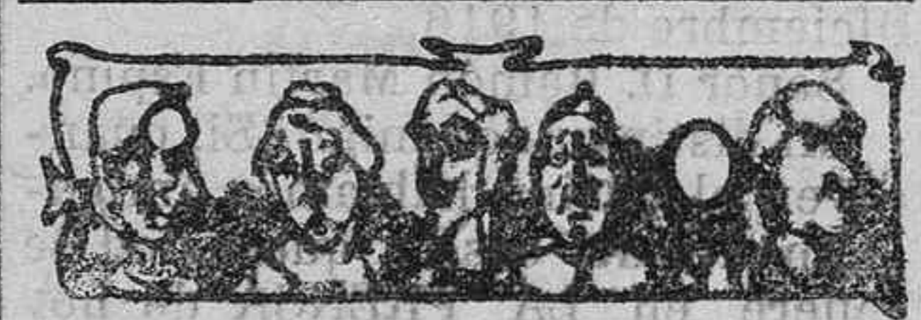
: ELEGÍACOS :

El servicio inaugurado por la Colonia Española de Cuba, dada la importancia de la Sociedad y las relaciones que sostiene en todo el territorio de la República, puede reportar grandes beneficios a muchos de nuestros compatriotas, sirvientes, braceros, etc., que por carecer de domicilio fijo en el país sufren las naturales dificultades en el recibo de la correspondencia que les llega de España, y por ello se hace público, a fin de que pueda llegar a conocimiento de los españoles que sostienen correspondencia con nuestros emigrantes en aquella isla.