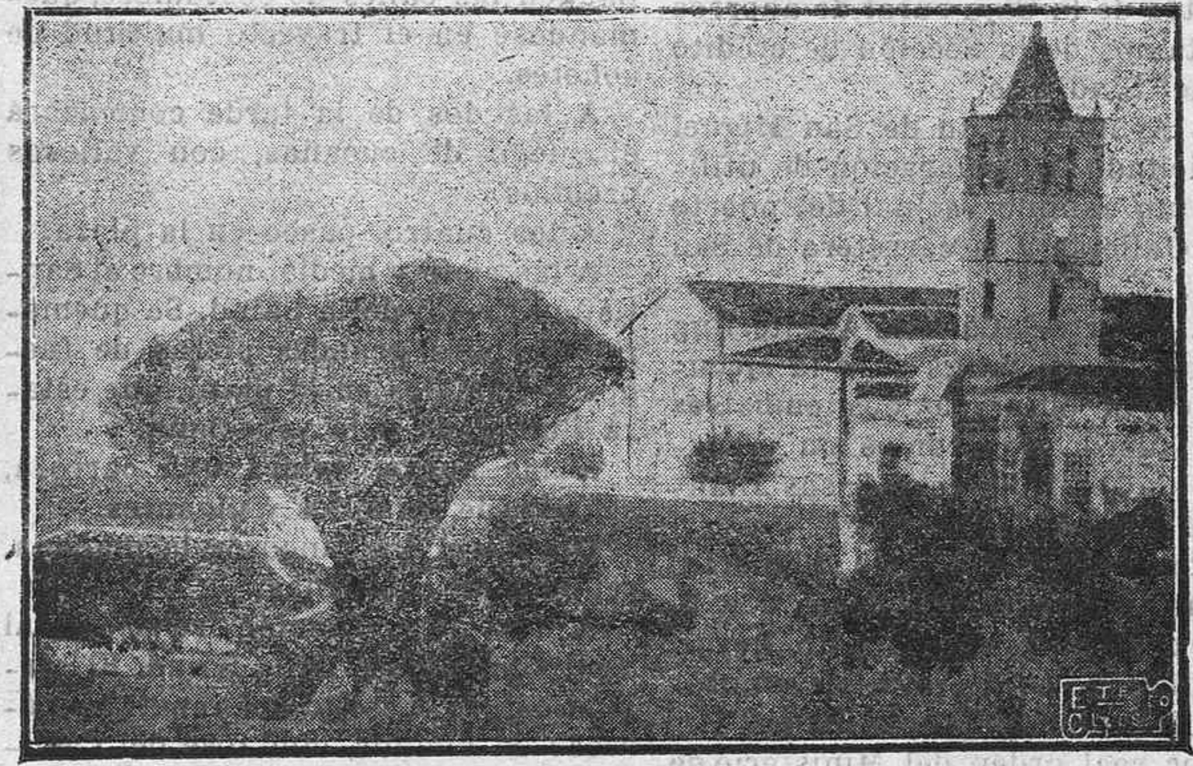
El histórico drago de Icod adquirido por el Ayuntamiento de aquella Villa

MEJORAS LOCALES EN ICOD.—EL HISTORICO DRAGO ADQUIRIDO POR LA MUNICIPALIDAD DE AQUELLA VILLA. REFORMAS EN LA CASA CONSISTORIAL.—CREACION DE ESCUELAS PUBLICAS.—LA ADMINISTRACION MUNICIPAL