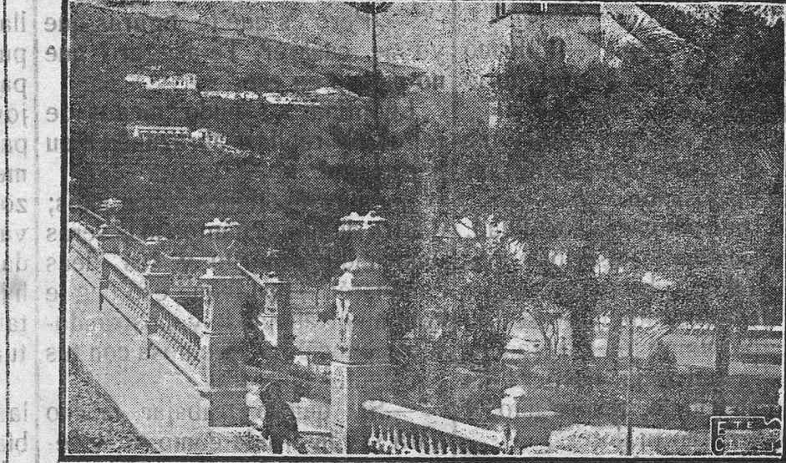
Parque de Andrés L. Cáceres donde se efectúan importantes obras