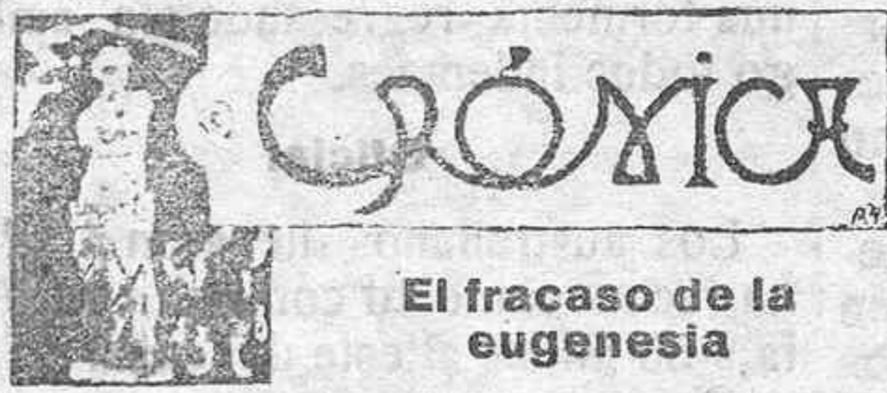
El fracaso de la eugenesia