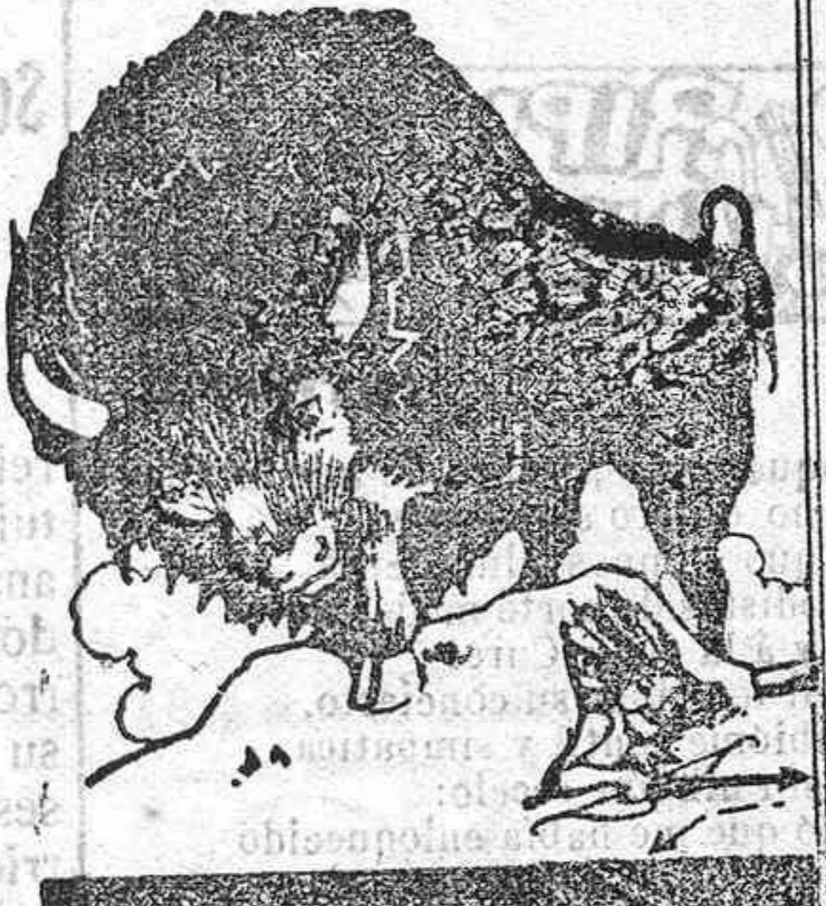
Pruébalo y ahorra su tiempo y su dinero.

el terror del día del lavado ha llegado a extinguirse por completo. Con el Sunlight Jabón como auxiliar, el lavado se termina rápidamente. El trabajo se aminora con su uso, se gana tiempo y se conservan las ropas. El Sunlight Jabón hace todo el trabajo. Para este objeto se ha ideado.