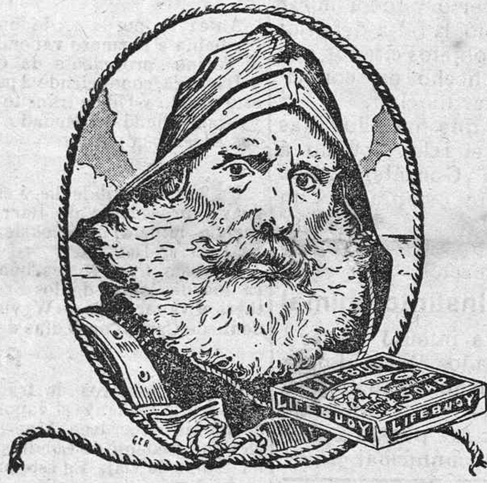
UN PRESERVADOR DE LA VIDA!