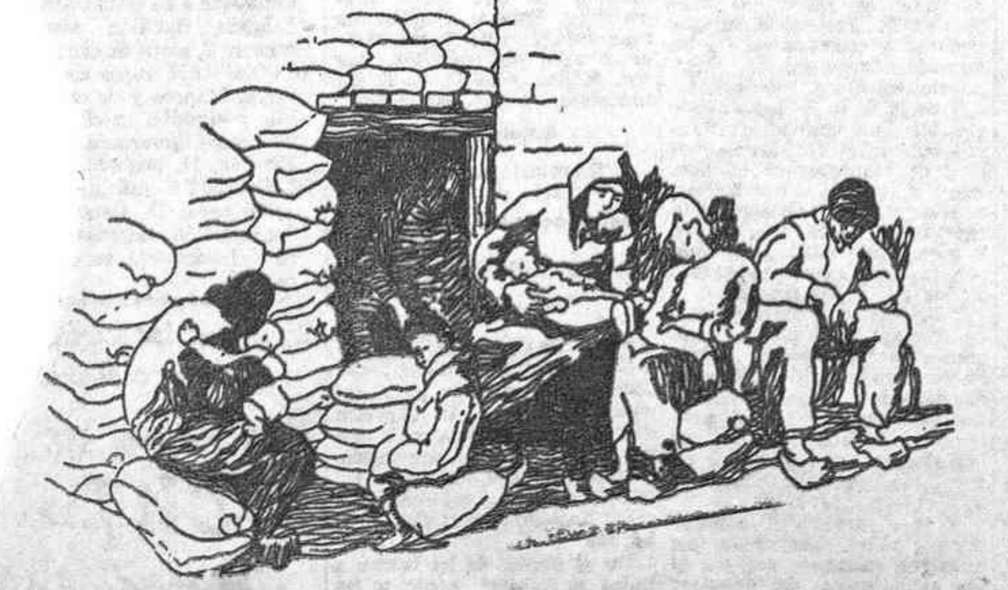
APUNTES DEL FRENTE—Puerta de un refugio

La edad de los aspirantes estará comprendida entre los 18 y 24 años Valencia, 26.— Por el Ministerio de Marina y Aire ha sido abierto un concurso para cincuenta plazas de mecánicos de Aviación entre individuos comprendidos entre los 18 y 24 años. Las instancias habrán de ser dirigidas al subsecretario de Marina y Aire, acompañadas de la partida de nacimiento y un documento de organización que el partido u organización afecto al Frente Popular exija que se haga constar en la declaración con anterioridad al día 10 de julio. También ha sido abierto otro concurso para 25 plazas de la especialidad de aviones de a bordo en idénticas condiciones.