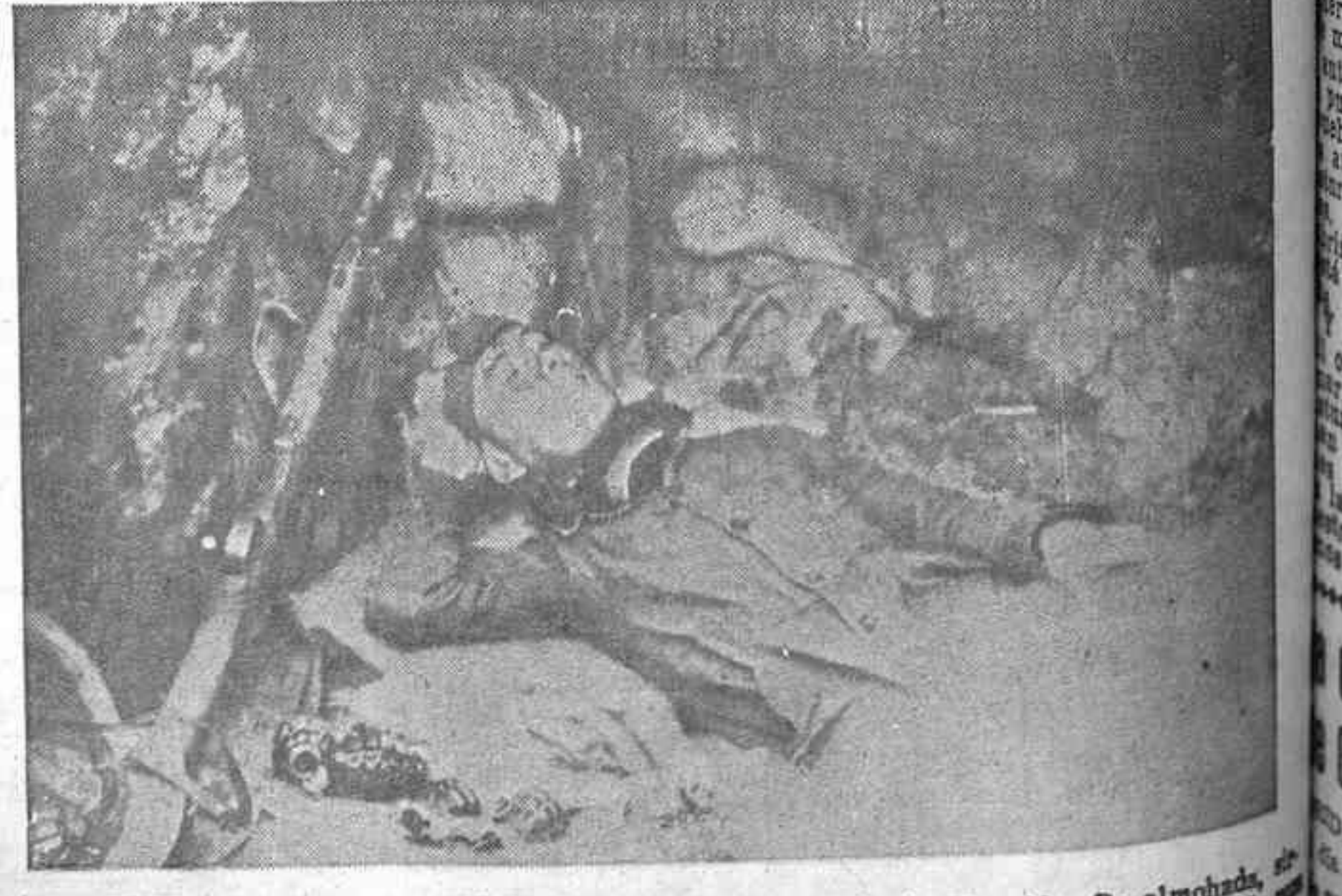
Duerme tranquilamente, a su vera varias bombas de mano, de las de piña. De almohada, son los sacos del parapeto. Estará tirando ahora a todo tirar. Pero hay demasiada suciedad para detenerse en estas minucias...