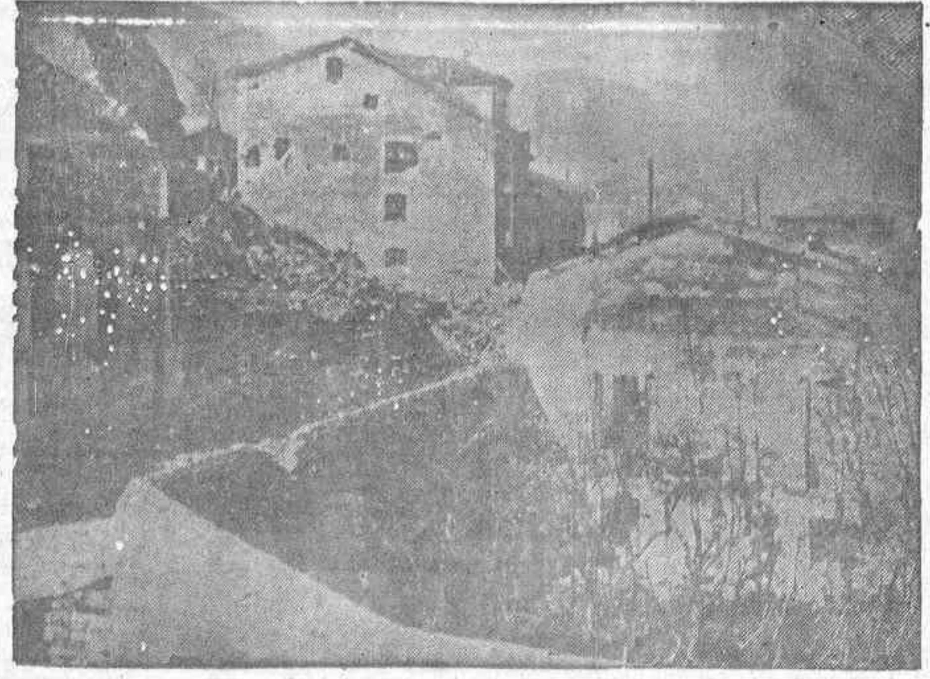
CALLE DEL ARZOBISPO GUIASOLA.—La que se ve agujerada en el Centro, es la primera casa de dicha calle. En ella está parapetado el enemigo. Cada boquete es una tronera

VARSOVIA, 21.—Según los informes facilitados por los médicos que le asisten el pianista Paderewski ex presidente de la República polaca, ha mejorado notablemente pudiendo considerarse fuera de peligro.