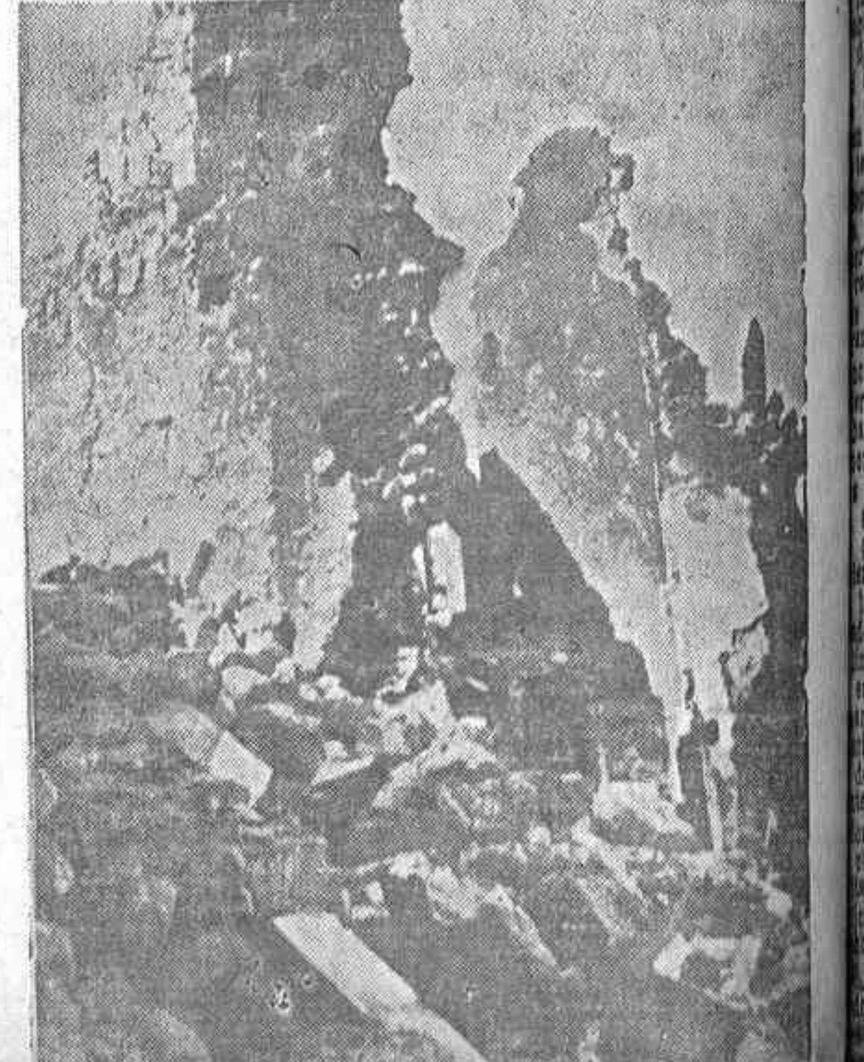
RUINAS DE OVIEDO.—Nuestra artillería gasta estas pequeñas bromas: De una casa de tres pisos quedan en pie dos pisos de pared...

VALENCIA, 21.— Los periodistas nacionales y extranjeros se han entrevistado tanto en Madrid como en Valencia con los prisioneros del Ejército republicano, hechos en el frente de Guadalajara. De labios de dichos prisioneros oyeron las siguientes palabras: —Estamos muy satisfechos del trato francamente bueno y humano que hemos recibido de los obreros españoles. Contrastan estas manifestaciones de los prisioneros y la actitud de quienes los han aprehendido con las amenazas de Franco quien ha dicho: «Todo extranjero cogido por nuestras tropas con armas en la mano será fusilado inmediatamente sin posibilidad de causas».