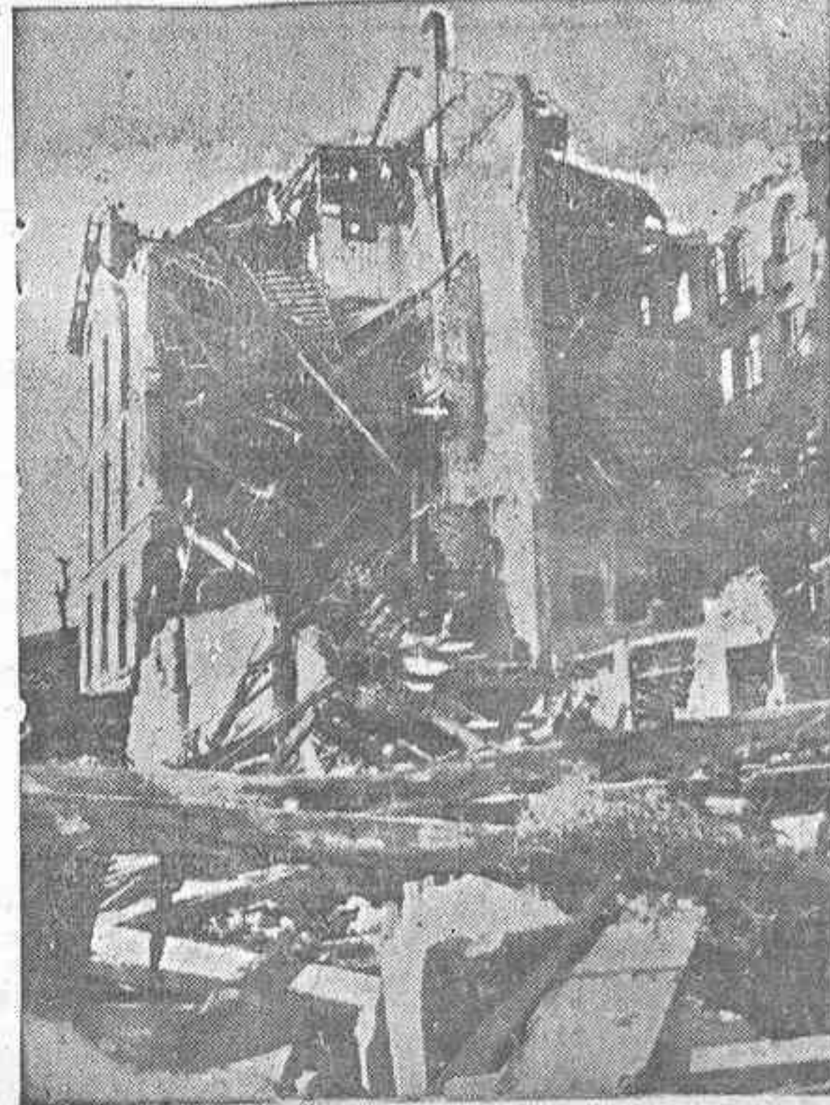
RUINAS DE OVIEDO.—Casas de La Puerta Nueva

El jefe de Policía va a tomar energicas medidas para impedir esta constante repetición de desórdenes.