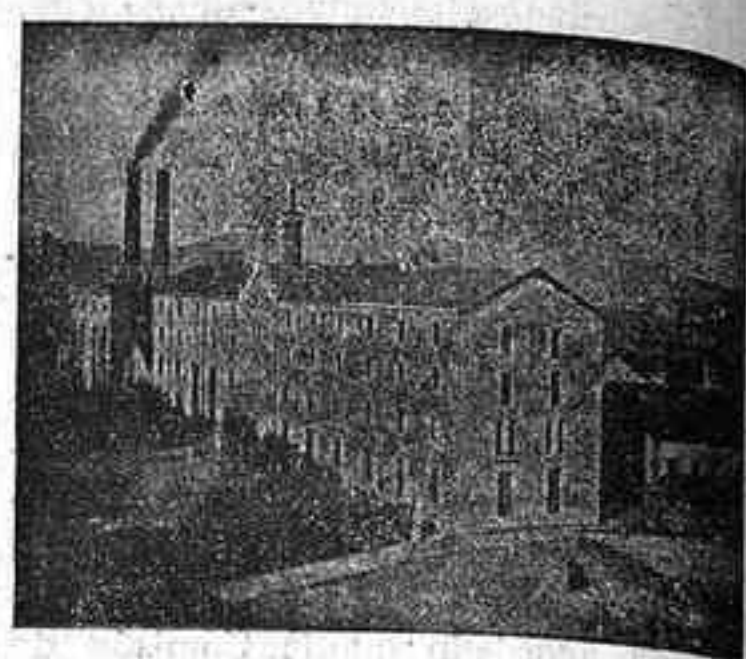
Vista de la Fábrica