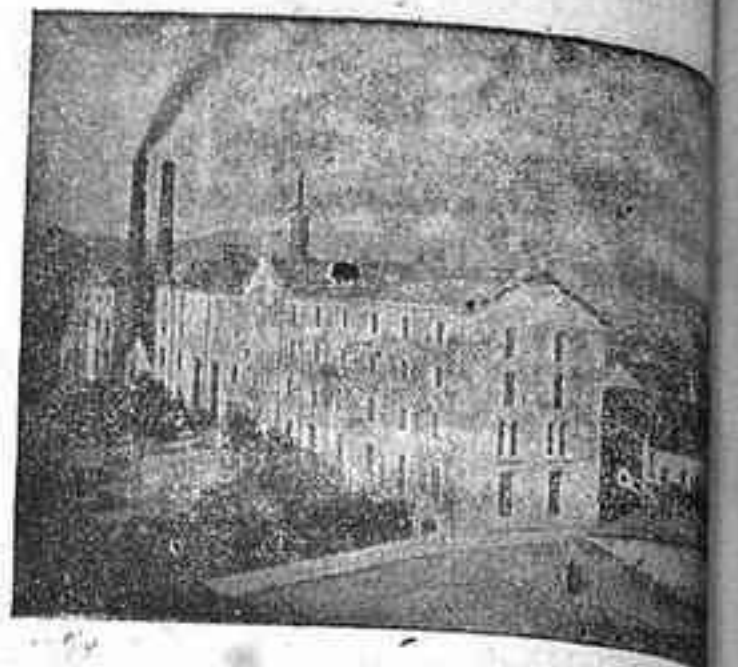
Vista de la Fábrica