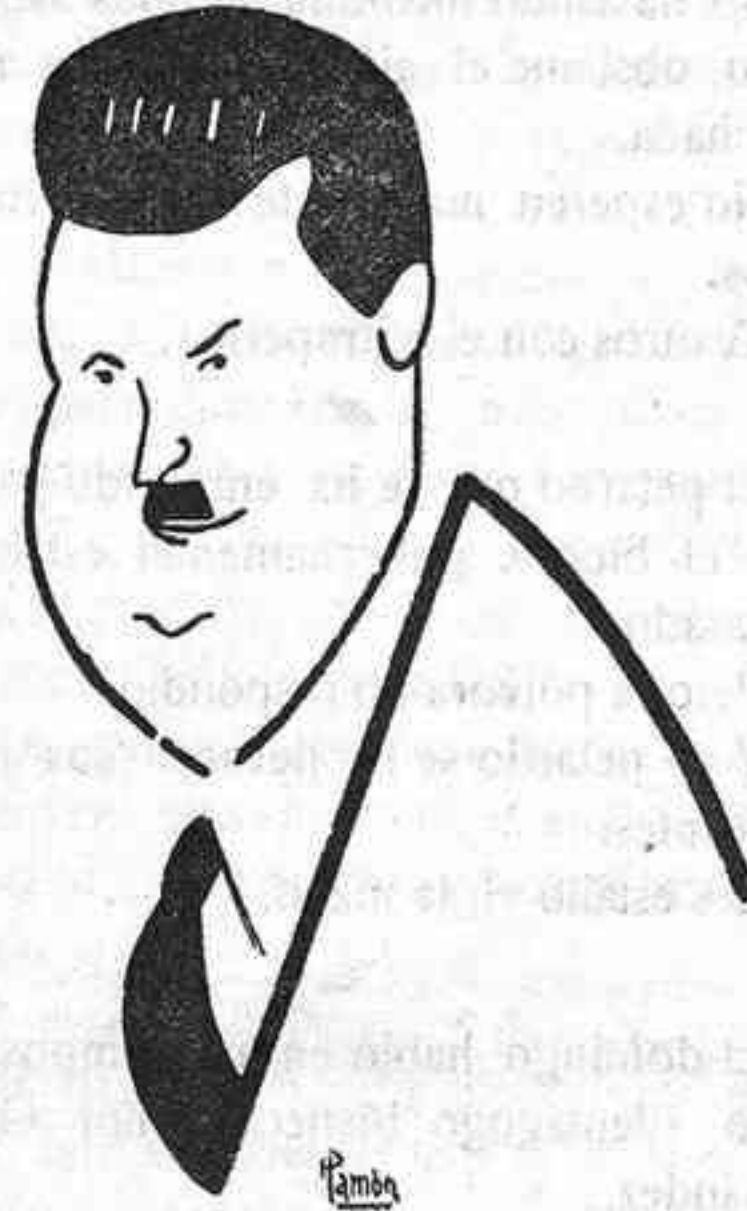
El exministro don Manuel Giménez Fernández, visto por uno de nuestros mejores dibujantes.

Ante todo, un deber cordial: daros las gracias. Hace mucho tiempo que fuí invitado a venir aquí; hace mucho tiempo que quería venir. Las cosas se