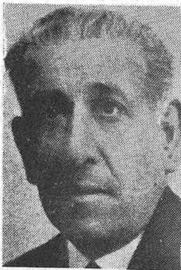
El ministro de Agricultura Sr. Velayos. (Agrario)

En fin Maura habló de en tono más moderado que de costumbre, tomando postura de Centro (la Derecha ya ve que voló para él) y Bolívar divirtió a la Cámara con sus truculencias. Y tras un discurso—resumen del Presidente del Consejo y la defensa calurosa de la confianza por Rey Mora, fué ésta votada nominalmente con 189 votos en pro del Bloque y algunas abstenciones de radicales, descontentos por el predominio de la Derecha en el Gabinete.