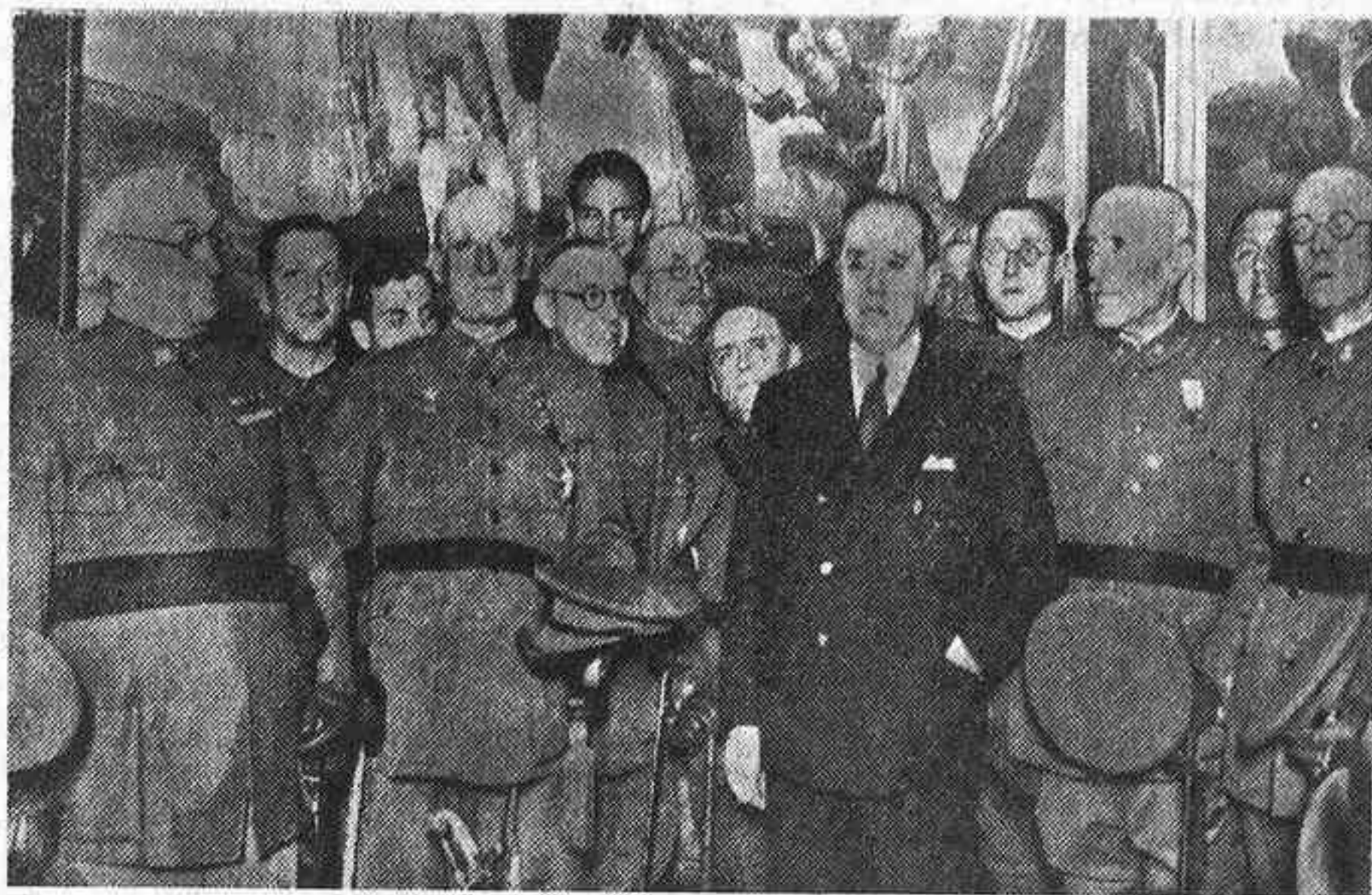
Gil Robles toma posesión en el Ministerio de la Guerra

Barrio en un mitin reconocía que podía desempeñar cualquier cartera con acierto: después del éxito reciente nadie negará que entiende mucho de estrategia y de táctica. Y sobre todo de patriotismo, que hay que insuflar a pulmón lleno en el Ejército para que vuelva a ser lo que siempre fué; y ya principió a hacerlo con pleno acierto en las palabras que dirigió a los militares reunidos en acto de presentación en el palacio de Buenavista.