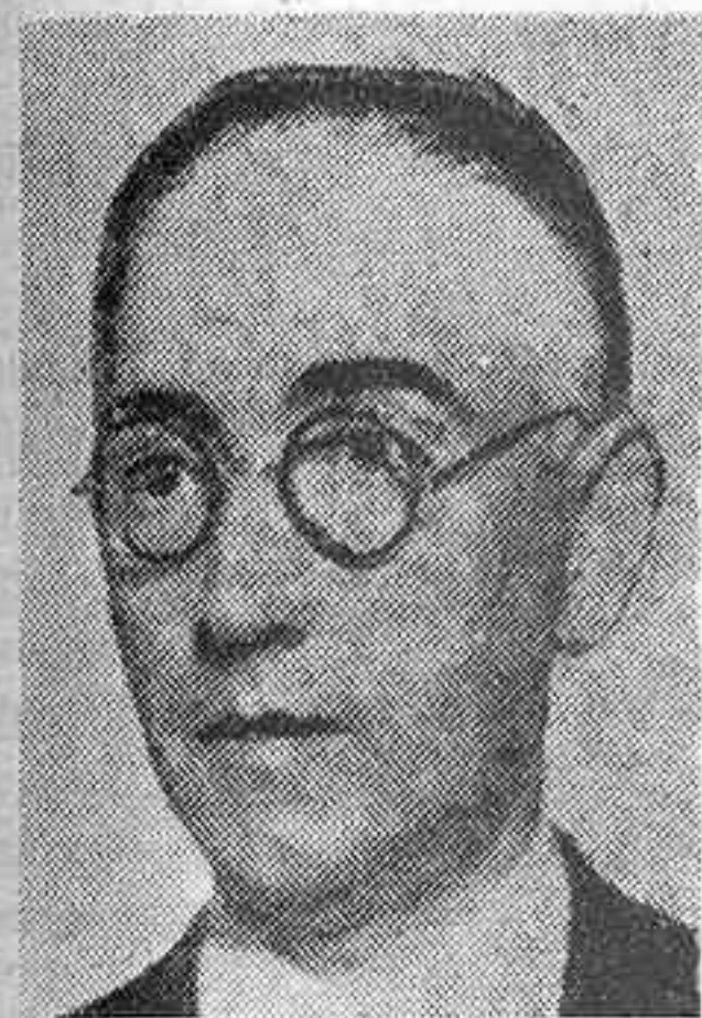
El ministro de Industria y Comercio, Sr. Aizpún (C.E.D.A.)

Rodez no hubo de reconocer «en este Gobierno el triunfo de la táctica de otras derechas que han colaborado con nosotros en ideales comunes», y que «elementos nuevos en política, a los que nosotros vemos llegar con gran satisfacción, no hubieran sido ministros de la Monarquía Constitucional por razones análogas a las que nosotros teníamos para no serlo tampoco». Cambó, en realidad no hizo otra cosa que lamentarse de que se hubieran arreglado sin él. Lara no dió saltos en el hemiciclo como aquella vez desde el banco azul; pero su intervención no fué mu-