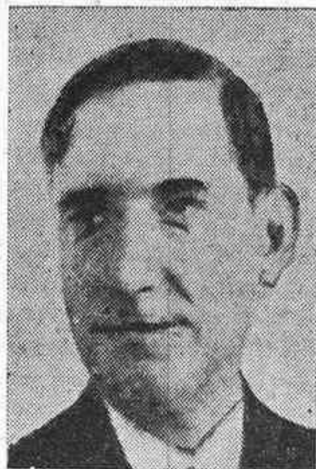
El ministro de Comunicaciones don Luis Lucía. (C.E.D.A.)

Es movimiento Político Nacional. Su Jefe es la gran figura de España. En sus filas caben todos los que sinceramente buscan el resurgir moral y material de España, en un porvenir glorioso con la mirada y el corazón puestos en las tradiciones de nuestro pasado.