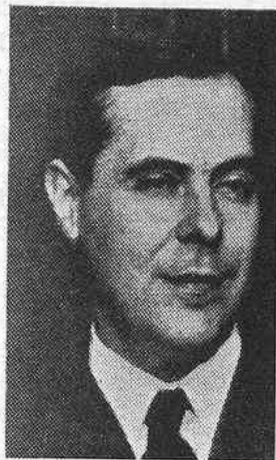
El ministro de Trabajo don Federico Salmón. (C.E.D.A.)

Gil Robles, nuevo ministro de la Guerra, no necesita presentación: el propio Martínez