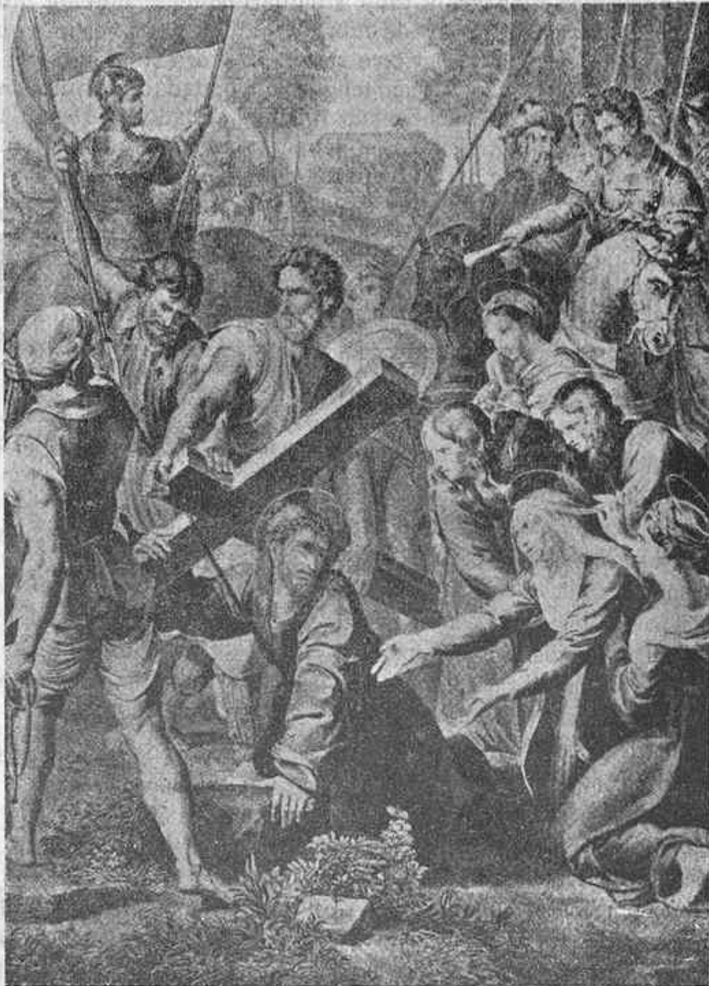
El célebre cuadro titulado "El pasmo de Sicilia" de Rafael