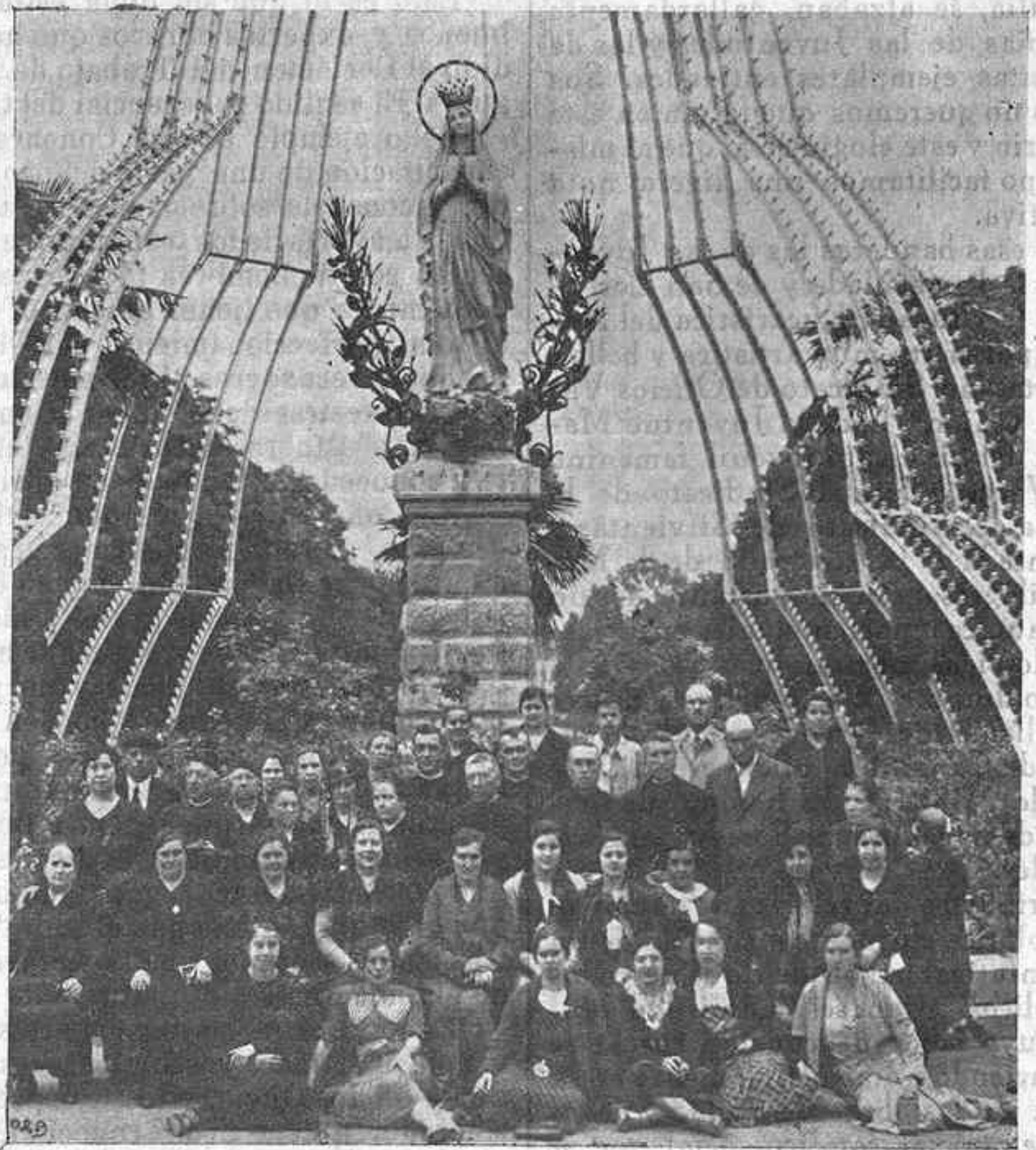
Un grupo numeroso de los cincuenta y seis gijoneses que, en los autocares de Rebollar y Revuelta, fueron a Lourdes en peregrinación fervorosa. Aparecen al pie del monumento erigido a la Santísima Virgen en la gran explanada de la Basílica.

sabidas preces, partiendo de las cercanías del templo parroquial de San José, emprendimos el itinerario.