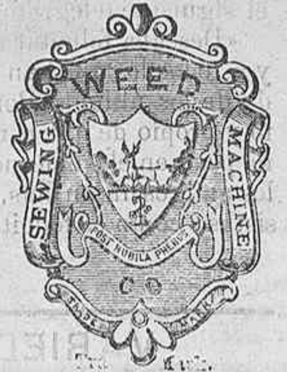
Without which none are genuine.

El representante de dicha compañía, informado que su encargado no ha contentado las personas que compraron sus máquinas, acaba de llegar espresamente á esta. Suplico á todos los que encuentren dudas ó dificultades, en el uso de sus máquinas, pueden dirigirse á él en la fonda de la Iberia. Teniendo un surtido de máquinas en esta, y tratando de dejar un depósito en Oviedo, pueden aprovecharse de mi permanencia en esta. 3-2