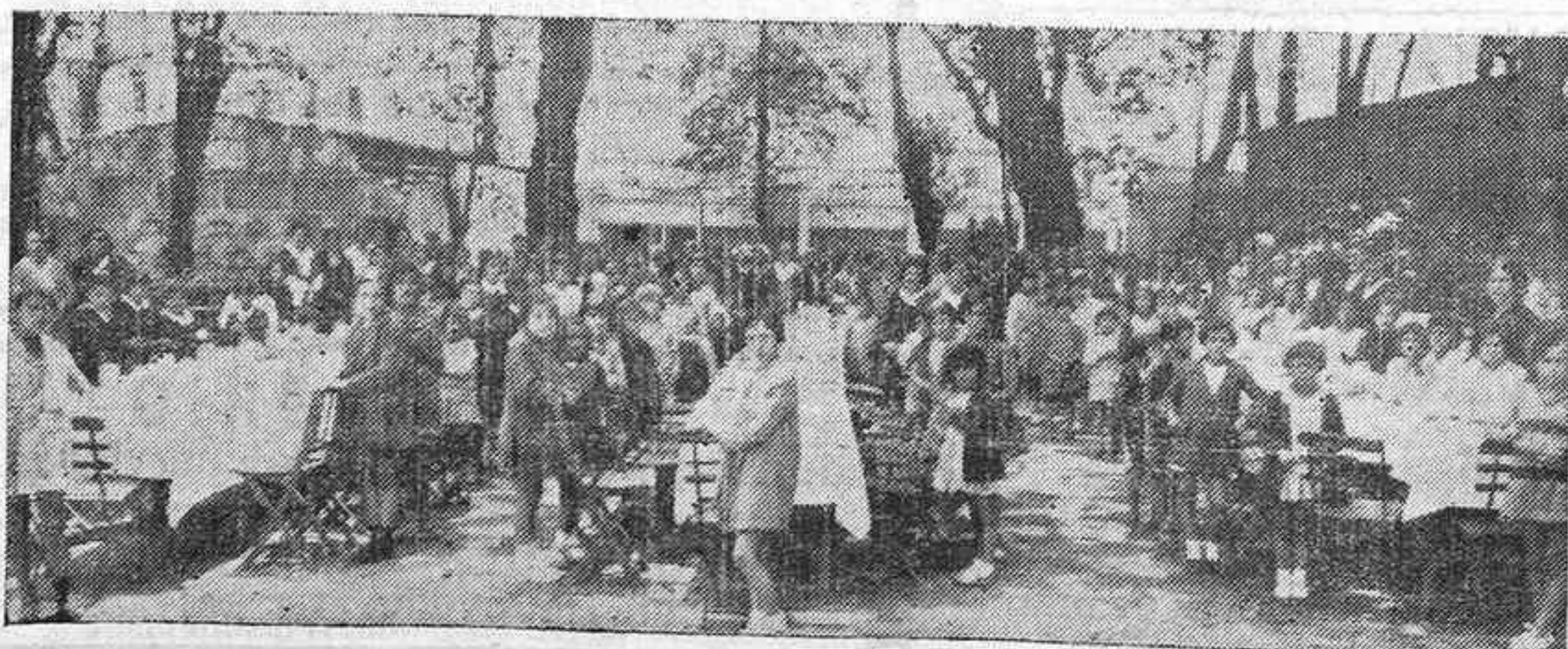
Un detalle del banquete con que fueron obsequiadas 150 niñas, servido por un grupo de socias de la Juventud Católica Femenina y costeado por esta Juventud de Gijón.

La dicha de estas niñas que en un verdadero día de