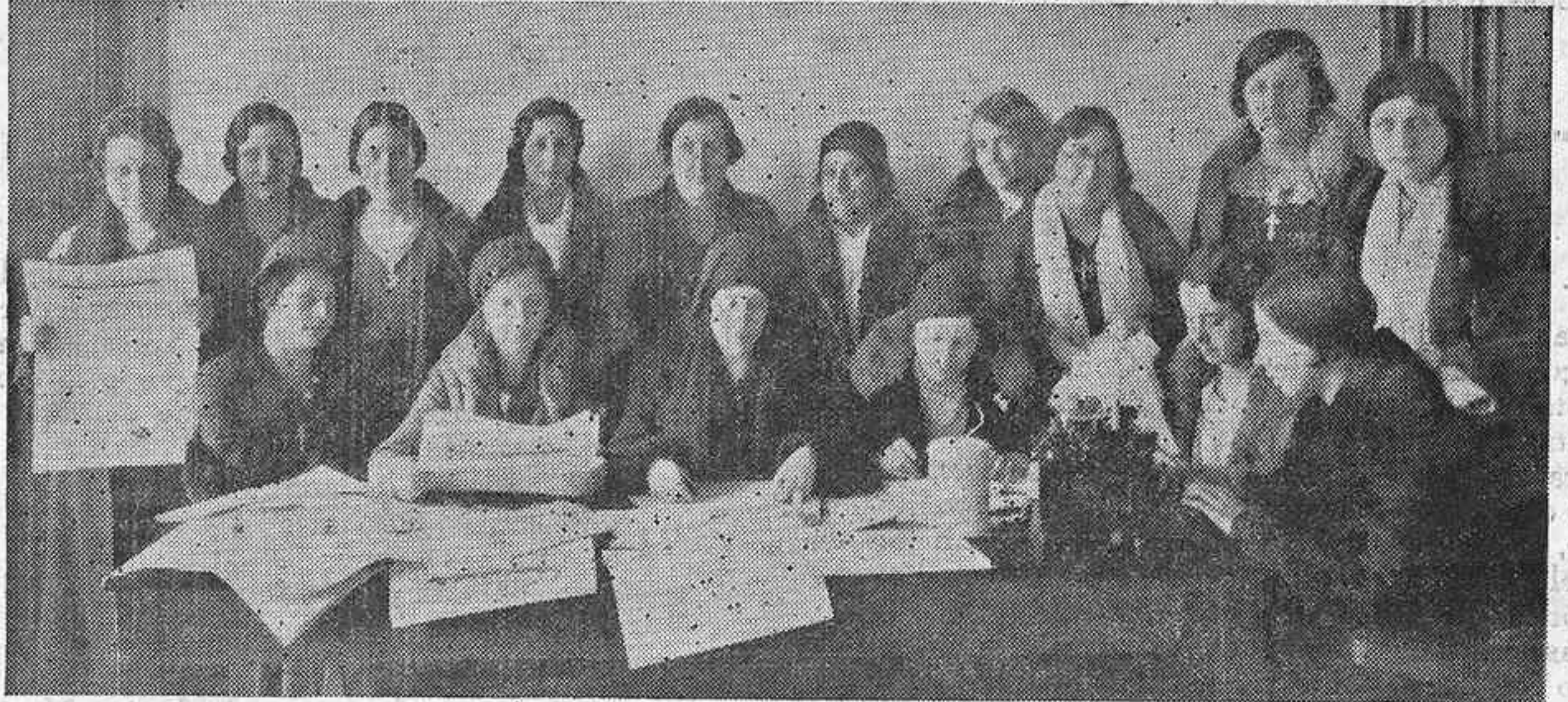
Las señoras y señoritas que componen la administración de ACCION y trabajan infatigables en su propaganda y distribución por toda Asturias.