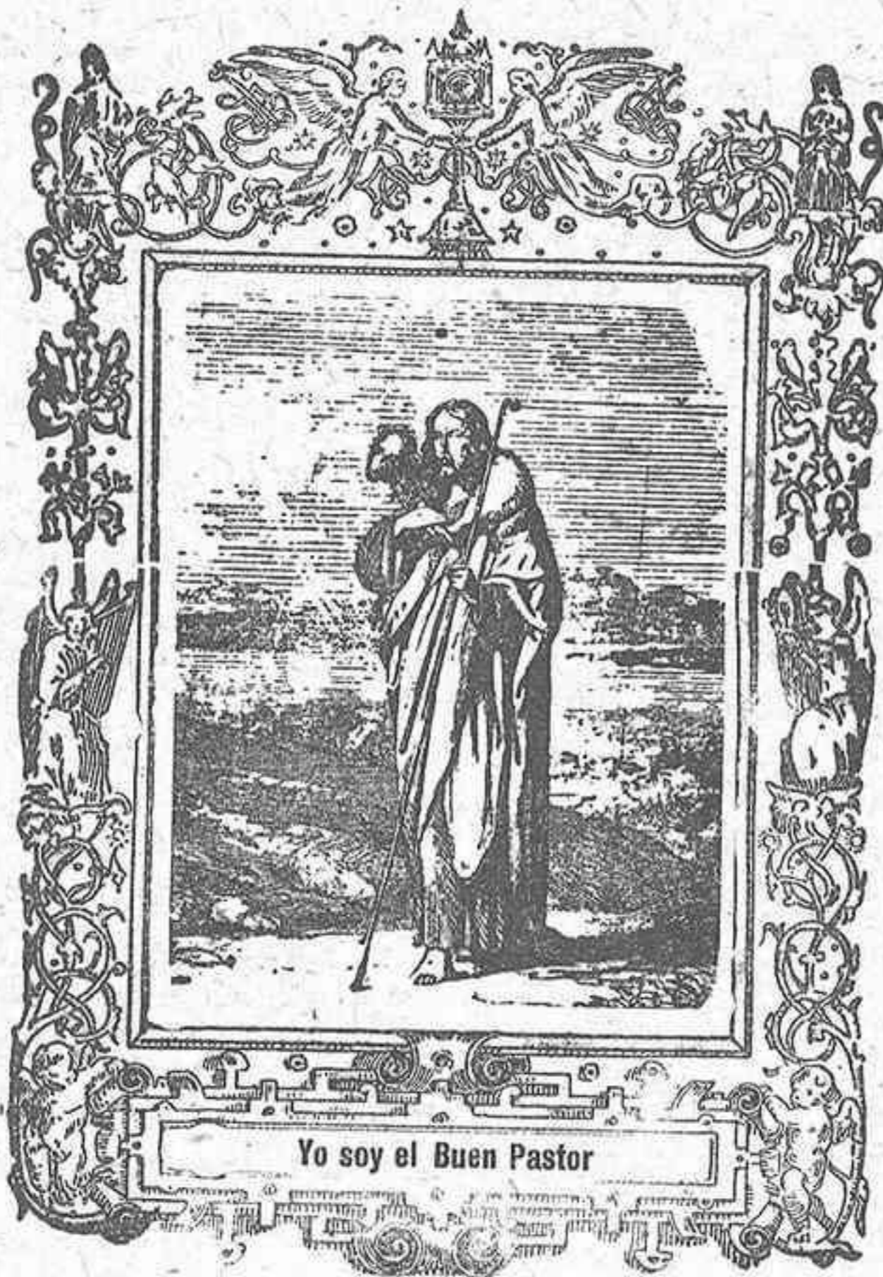
Yo soy el Buen Pastor

De Cristo oveja serás, si en su redil permaneces y a su Vicario obedeces; mas, si no, de Satanás.