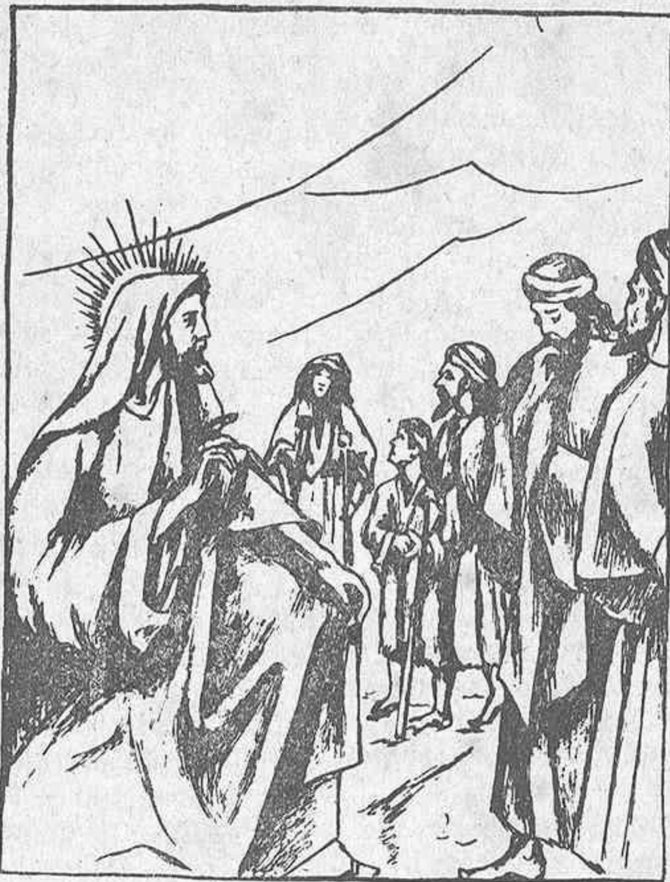
¿Eres tú el que ha de venir?

La contestación de Jesús fué plenamente convincente, puesto que contestó con obras, más bien que con palabras. Los discípulos de Juan y cuantos estaban bien dispuestos en su corazón creyeron en él, le tuvieron por el auténtico Mesías; mas los judíos carnales, los