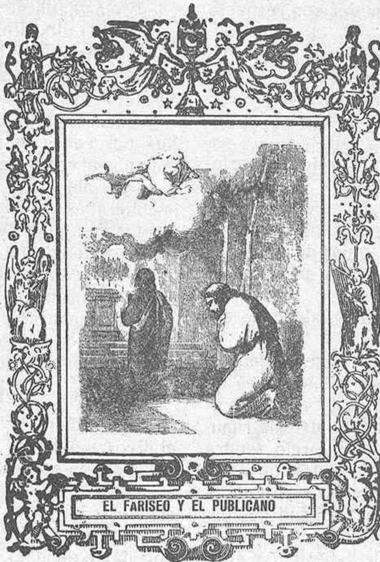
EL FARISEO Y EL PUBLICANO

Veamos lo que contesta nuestra conciencia a estas y otras preguntas parecidas, enmendemos los pasados yerros, y dejémonos de declamar contra los demás.