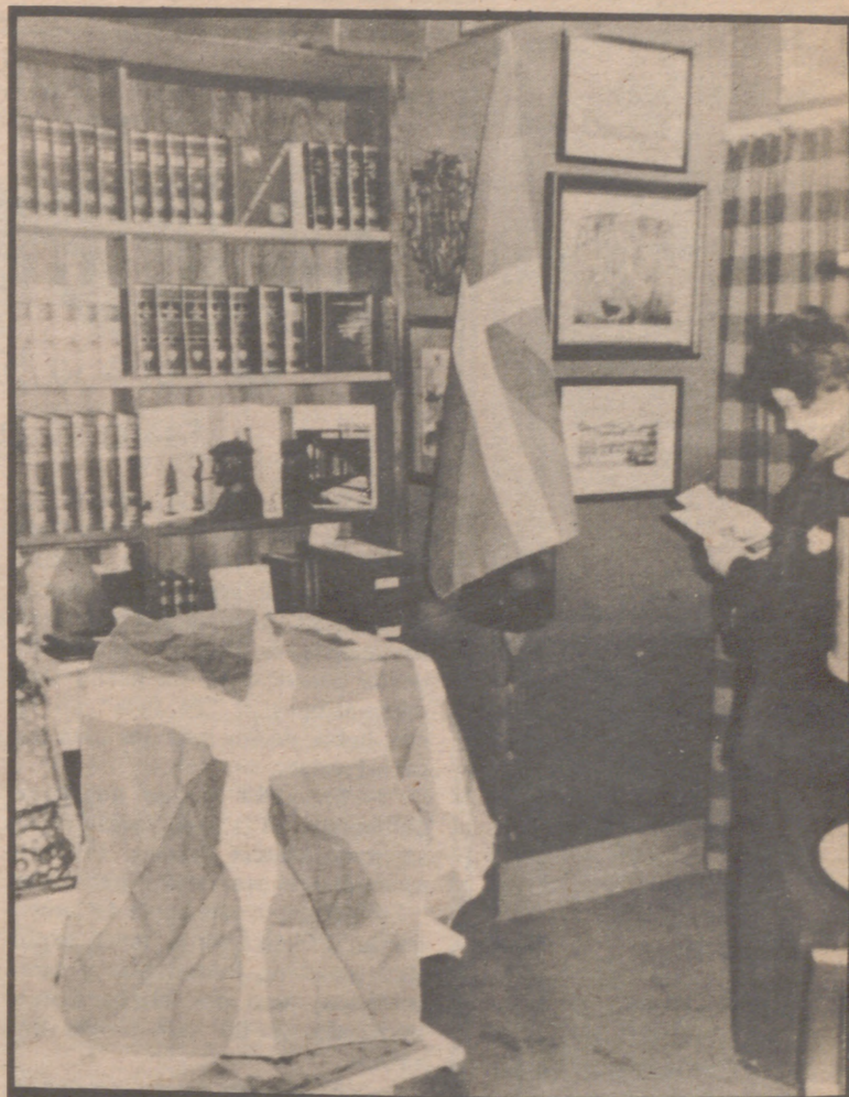
En la foto, un comercio bilbaíno donde se ha iniciado la venta generalizada de "ikurriñas".

BILBAO, 20 (Logos).— Para las siete y media de ayer tarde