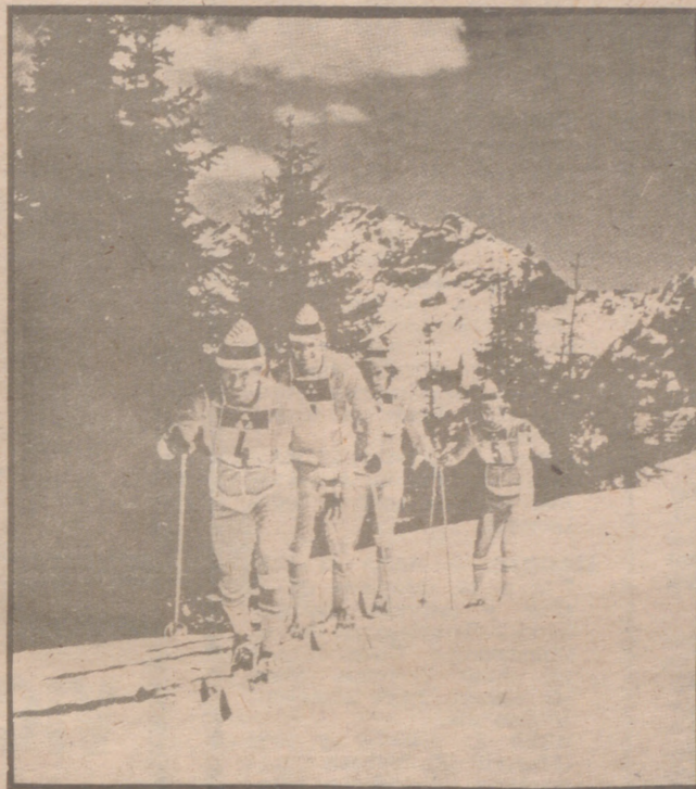
EL TROFEO "PANTICOSA" DE ESQUI NORDICO

Parece ser, que alguna estación española empieza a dar importancia a uno de los deportes más completos que existen como es el esquí de fondo. Sobre este tipo o modalidad deportiva existen dos tipos claramente definidos. Uno el dedicado a paseo, apto y muy bueno para todas las edades, y el otro de competición que es el que a través de los servicios de información más conocemos en España.