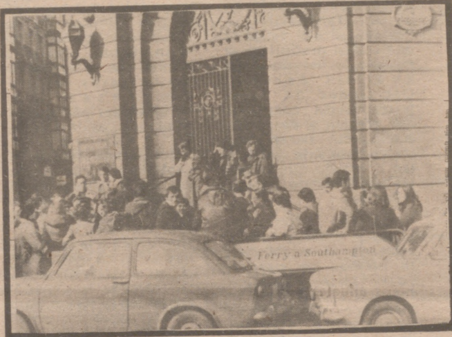
BILBAO.— Unos ciento cincuenta profesores no numerarios se han concentrado en la puerta de la Delegación Provincial del Ministerio de Educación y Ciencia, para pedir la estabilidad laboral.

"Por lo demás, añade, sobre la actitud ante el diálogo y la negociación del actual equipo ministerial, puede agregarse que desde el pasado día diez de diciembre espera respuesta a unas peticiones la mencionada asociación, sin que haya habido, ni siquiera, acuse de recibo, y sin que el ministro y los dos