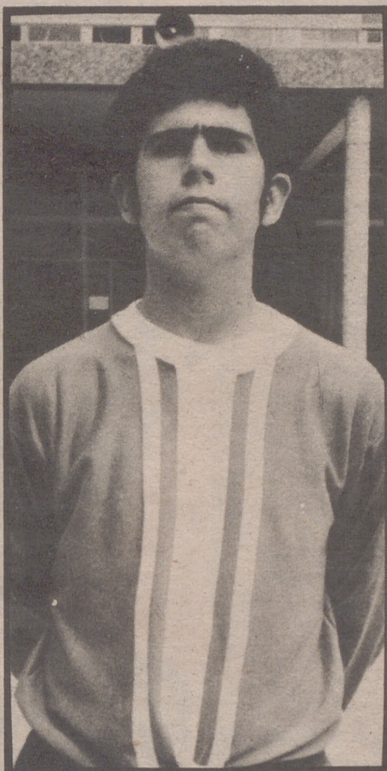
LISBONA, Portero del Boscos infantiles, encajó 3 goles en 16 partidos.