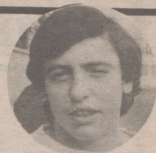
Giménez II puede ser la figura de la próxima temporada

Los entrenamientos de Luis Gómez han sido duros. Tres días de entrenamiento a la semana. Al principio algunos jugadores caían sin fuerzas. Ahora se les ven con fuelle intacto al terminar su trabajo físico. Entrenador y jugadores que tienen ante sí una oportunidad insuperable de hacer nombre, sobre todo actuando en una ciudad como Calatayud. Después de ver la