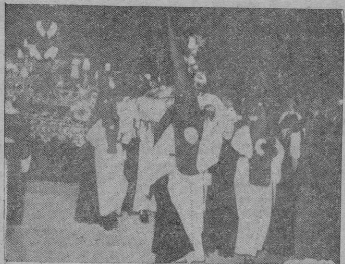
Un aspecto de la procesión del Entierro que el viernes por la noche desfiló por las calles de la ciudad