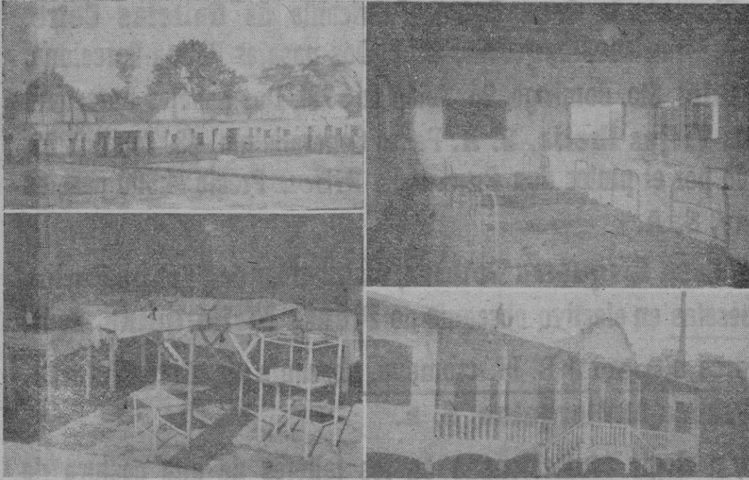
Fecha, hospital finca Estrada. Izquierda, sala de curas hospital de la finca Etembue. Derecha, una sala del hospital de Mofó. Izquierda, Viviendas de braceros en la finca Vaz Serra

Sin ellos podrias no obstante saber que se ha instalado un industria de fabricación de crema de cacao, con modernísima maquinaria, que se ha plantado una