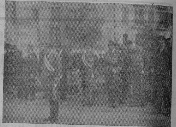
El Excmo. señor Capitán General y demás autoridades castrenses y civiles presenciando el desfile de las tropas