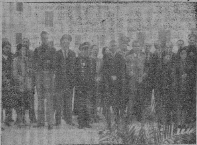
Algunos de los inquilinos que ocuparán las nuevas viviendas