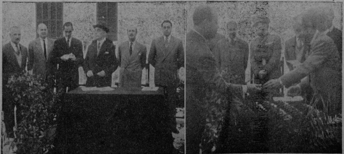
Las autoridades que presidieron el acto. El Gobernador Civil entregando las llaves a uno de los inquilinos