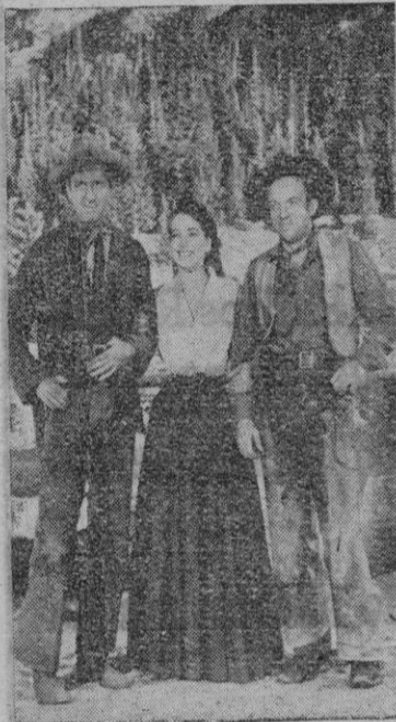
Los protagonistas de «Horizontes lejanos» en una escena de la película

En la película estrenada ayer la anécdota se contrae a la con-