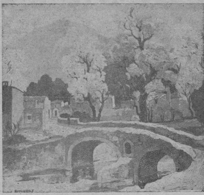
«Canción Pollensina», óleo de Dionisio Bennasar que figura en la exposición que realiza actualmente en Galerías Quint y a la cual se refirió en su nota publicada ayer nuestro crítico de arte Luis Ripoll