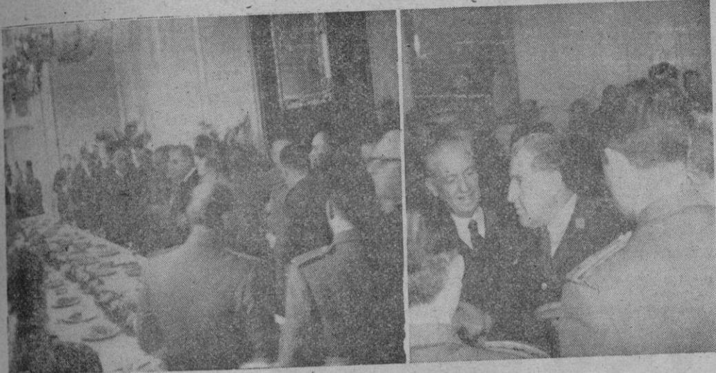
Grupo de asistentes al vino de despedida que ayer al mediodía ofreció en los salones de Capitanía General el Teniente General don Antonio Alcubilla, quien aparece en la fotografía de la derecha mientras pronunciaba su brindis