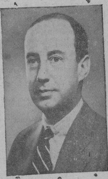
Estes Kefauver, senador por el estado de Tennessee, considerado como uno de los posibles candidatos al partido democrático a la Presidencia de los Estados Unidos, aunque Harriman parece el más serio competidor.

Washington, 10 (Urgente). — El Presidente Truman se dirigirá a las cinco y media de la tarde, hora española, al Senado y la Cámara de Representantes reunidos en sesión conjunta, para hablar de la cuestión del acero, anuncia el Secretario de Prensa de la Casa Blanca.