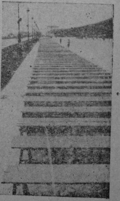
La larga teoría de bancos a lo largo de la Diagonal; al fondo se divisa apenas la silueta del gran altar

Poco después, Su Excelencia se dirigió a la capilla del Santo Cáliz, en la que se conserva el