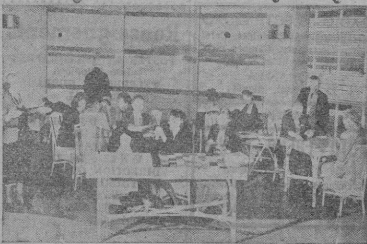
Sobre la bahía de San Francisco, se ve el importante puente de Golden Gate desde donde puede verse el importante puente de Golden Gate

—Y no creáis que viven en cualquier sitio, no. Disponen de un local, desde cuyos balcones de la sala —circular y decorada con motivos marítimos— se domina la espléndida vista panorámica de la bahía de San Francisco, con su puente de Golden Gate cruzando