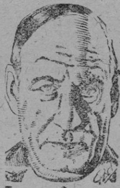
Ortega y Gasset

Zurich, 24. — La unidad europea no es una fantasía, sino la realidad misma, afirmó don José Ortega y Gasset en la última de sus tres conferencias en el Instituto Superior Técnico de Zurich, ante numeroso y distinguido auditorio, que lo aplaudió largamente.