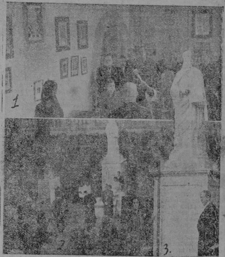
1: Descubrimiento y bendición de la lápida dedicada al P. Pascual. -- 2: Durante la lectura del discurso de la Sta. Saenz de Tejada en la inauguración del monumento a Ramón Llull. -- 3: Vista del hermoso monumento a cuyos lados aparecen los padrinos señoría Saenz de Tejada y señor Zaforteza y de Olives.