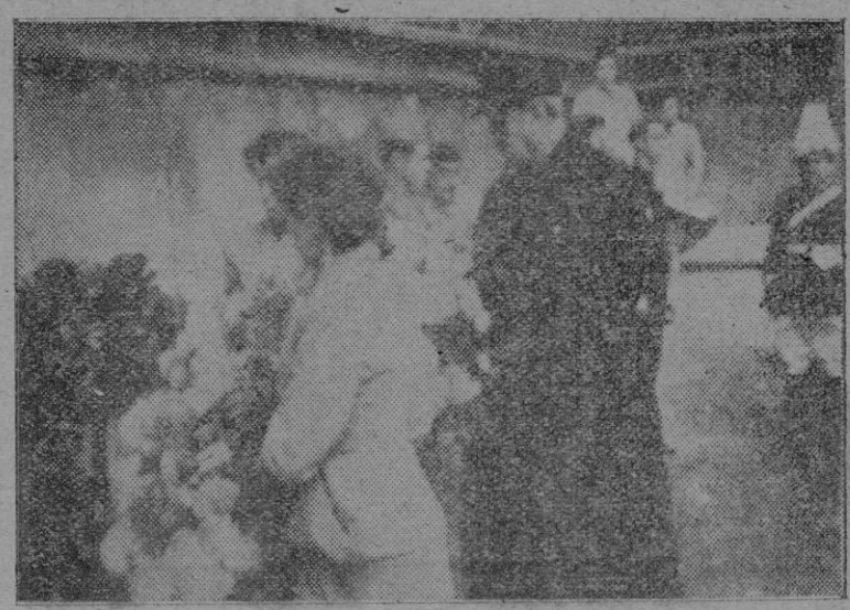
Nuestra primera autoridad civil durante la ofrenda floral al fundador de Falange