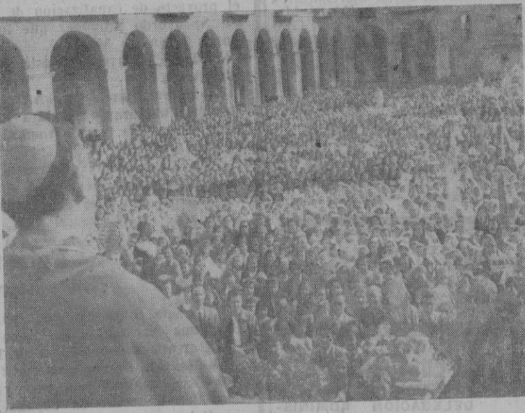
El Excmo. y Rdmto. señor Obispo dirigiendo la palabra a los niños congregados en la Plaza Mayor ayer por la mañana, como acto final de la misión infantil