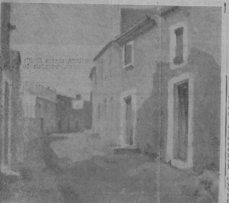
"Calle en siesta", de M. Llabrés

López Molina (C. de Bellas Artes) siente, sobre todo, el paisaje urbano y lo interpreta con suficiente técnica de acuarelista. Uno de los mejores ejemplos de lo que se acaba de escribir está quizás en su acuarela señalada con el número 14 del Catálogo, que titula "Hacia el mar", donde se hermanan los elementos puros y los que derivan hacia un aspecto arquitectónico. Totalmente reflejando un motivo