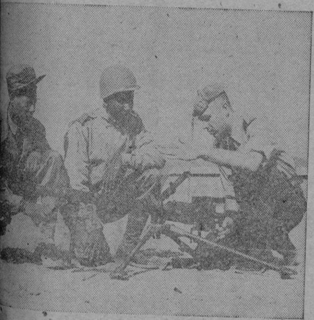
Instructor holandés, explicando al manejo de una ametralladora de calibre 30 mm. a dos soldados etíopes en un campo de instrucción en Corea

Washington, 7. — Funcionarios norteamericanos —según anuncia la United Press— han manifestado hoy que se proyecta enviar este mes a España a varias misiones norteamericanas para estrechar las relaciones entre ambos países.