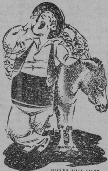
CUANDO HACE CALOR

Sin más asuntos que tratar se levantó la sesión.