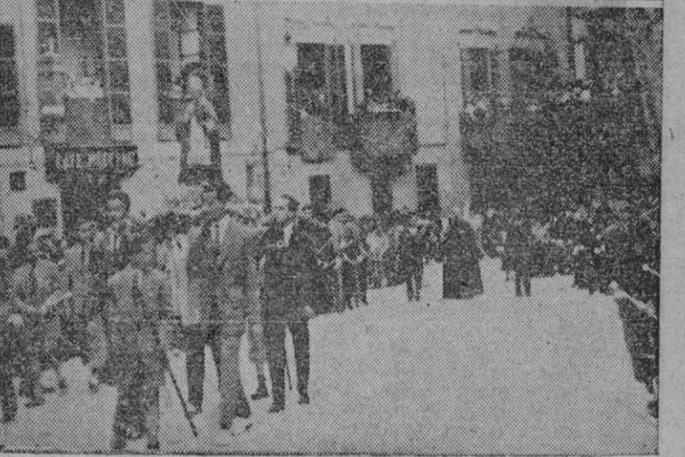
El público estacionado frente a la Catedral viendo desfilas la procesion. — El solemne cortejo religioso a su paso por la plaza de Santa Eulalia