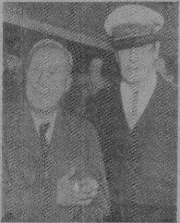
MAG ARTHUR y S. RHEE

La guerra en Corea se alarga y se complica ante las grandes centrales hidroeléctricas del río Yalu que abastecen de fluido y energía a parte de Manchuria. ¿Entrará en guerra Mao-Tse-Tung? ¿Las divisiones chinas que luchan en el Noroeste coreano son ya un anticipo? Pero, mientras tanto, no olvidemos que la cuestión coreana casi empieza ahora. Ahora, que puede llamarse ya cuestión china. Sin embargo, Mac Arthur —que es siempre sincero y rectilíneo— no se siente pesimista ante la nueva situación y el cambio que ha efectuado la lucha en estas últimas jornadas. Estima que se están dando los últimos coletazos desesperados de los rojos. "Los ejércitos derrotados —dice— muchas veces hacen su última resistencia desesperada. Es el caso de Inchón, pero al revés. Lo que está ocurriendo es, probablemente, que cierto número de divisiones de refresco están siendo usadas contra nosotros en ataques en masa, y de frente, y han alcanzado algún éxito. Solo así se comprende que después de que las tropas de las Naciones Unidas han hecho 135 mil prisioneros y han causado a los comunistas otras 200 mil bajas, estos tengan todavía fuerzas para llevar a cabo contraataques. La situación se convertiría en muy grave si un Gobierno extranjero interviniera oficialmente con todas las fuerzas que tenía a su alcance. No creo que esto llegue a ocurrir".