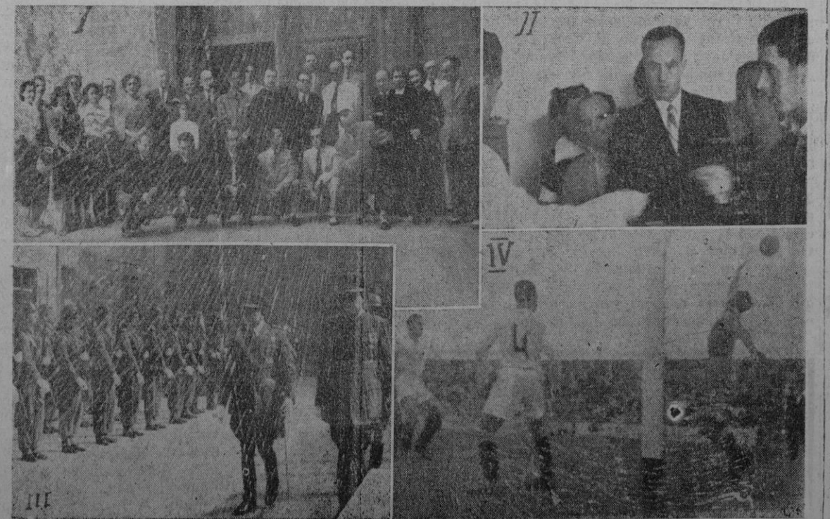
I Los periodistas y algunos familiares después de la misa celebrada en las Teresas. — II Durante la elección sindical. — III El Excmo. Sr. Capitán General revistando las tropas de Intendencia que le rindieron honores. — IV Una de las jugadas en el partido de "Es Forti".

necesarios en los servicios de la defensa civil, cuyo personal es escaso, recordó que la Gran Bretaña está fortaleciendo sus defensas conjuntamente con muchas otras naciones libres, para contener a todo agresor en potencia, pero indicó que Gran Bretaña puede ser mortalmente atacada por aire.