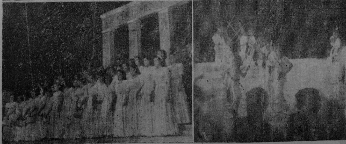
Arriba izquierda: Los grupos folklóricos entrando en las cuevas del Drach. — A la derecha: Los jefes de grupo premiados en la sesión de clausura, después de recoger los premios. — Abajo izquierda: la formidable masa coral de Cartagena durante su actuación en el Coliseo Balear. — Una figura de los danzarines de Cabezón de la Sal