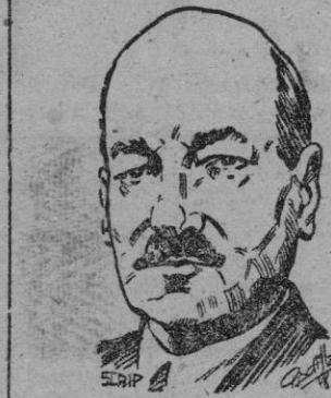
Mr. Atlee, pendiente de una mayoría precaria

«Hay muchos síntomas de crisis incipiente: Las reservas peligrosamente reducidas en Gran Bretaña; el aumento de los gastos, de los precios y de los costes, como los 27 millones de libras más para el transporte, todo constituye una seria advertencia. Muchas personas no lo ven. El motor del estado —añade