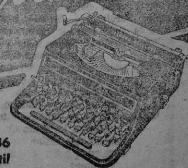
M. S. 46 Tipo Semiportátil

Fábrica y Oficinas: Avda. José Antonio, 860-872 BARCELONA