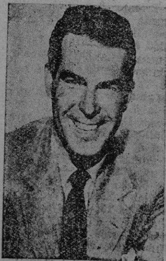
Fred Mc. Murray

los tres niños, sin ser extraordinarios, se desenvuelven muy bien ante la pantalla. Bien Rita Johnson en el papel de rival de Claudette Colbert.