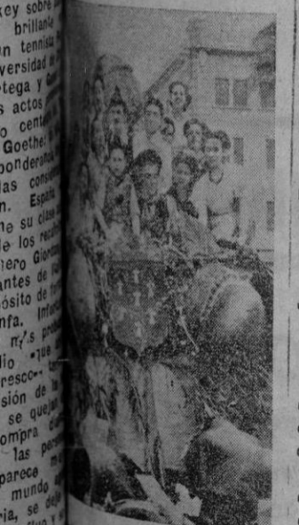
Carroza de las granas...