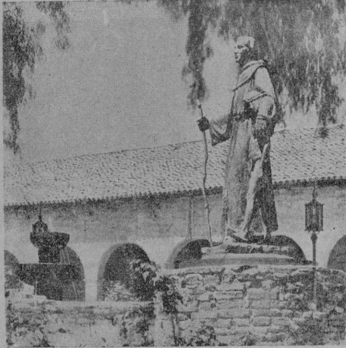
Estatua de bronce de Fray Junipero Serra en la Misión de San Fernando, con la que limita la ciudad de Los Angeles (EE. UU.)

Ello nos lleva a hablar de los retratos.