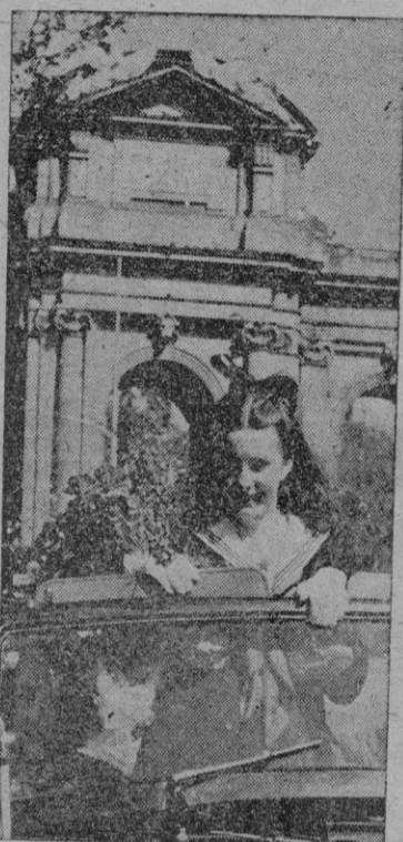
Margaret O'Brien cruza ante la puerta de Alcalá momentos después de su llegada a la capital de Europa

Revista en el Fuencarral, la misma compañía y la misma obra, "Los dos iguales"; revista en la Latina, que estrenará "Los babilonios", del maestro Rosillo, y no hay más revista porque no quedan más teatros.