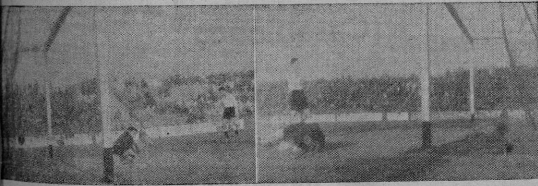
Los dos goles marcados por el Mallorca