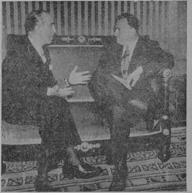
Quito. — D. Rafael de los Casares, a la izquierda, conferencia con el Presidente de la República del Ecuador, D. Galo Plaza, después de la ceremonia de presentación de cartas credenciales.

Presentación de credenciales del Ministro de España en Quito