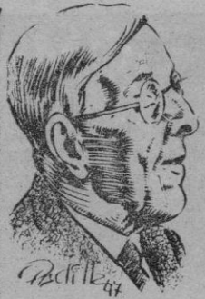
Marqués de Valdeiglesias

Madrid, 24. — Esta tarde, a las cinco y media, se ha efectuado el entierro del decano de los periodistas españoles, Marqués de Valdeiglesias, fallecido ayer. El acto ha constituido una gran manifestación de duelo al que se